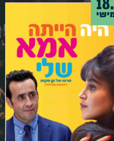
היה הייתה אמא שלי