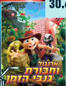
ארנגול וחבורת גנבי הזמן