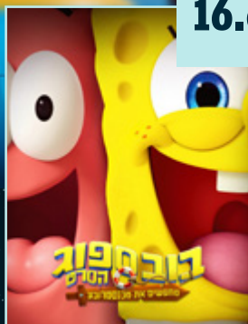
בובספוג מחפשים את מנסמרובע